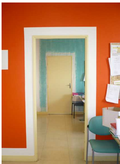
Christophe Cuzin, BIENPEINT/MALPEINT (détail), 2000/ mars 2009, secrétariat de l'IUT, Rennes, Collection Frac Bretagne © Adagp