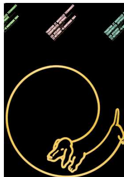
Shigeo Fukuda. Traditions et nouvelles techniques , 1984 Affiche, collection Frac Bretagne