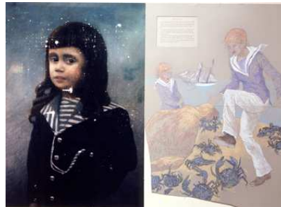
Jean Le Gac. Le délassement d'un peintre parisien (avec mousses et goélette) , 1984 Photographie et pastel sur carton, collection Frac Bretagne