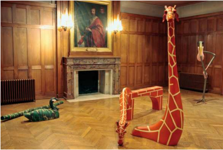
Jean-Yves Brélivet. La soif des uns fissure les autres , 1992 Un aboès dans le ciel , 1997, Leurres en exercice , 1998 Sculptures, collection Frac Bretagne

Quel que soit le sujet choisi, Shigeo Fukuda joue sur les illusions d'optique et les anamorphoses. Le traitement des chiens ne fait pas exception à cette intelligence du regard, qu'il s'agisse d'un teckel enroulé sur lui-même jusqu'à ressembler à un escargot, ou bien d'un grand chien noir et blanc et son ombre inversée faisant songer à un puzzle inachevé.