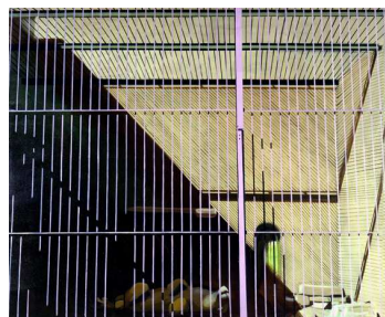
Gilles Aillaud. Grille n°2 , août 1964 Huile sur toile, collection Frac Bretagne