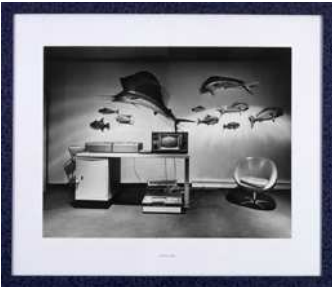
Lynne Cohen. Recordind studio , 1987 Photographie, collection Frac Bretagne