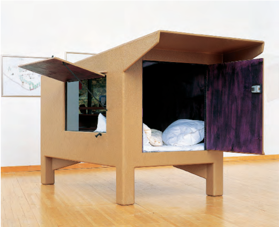
• © Joep van Lieshout (1963 Ravenstein, Pays-Bas), Mini capsule , 2002, installation, bois et résine, 160 × 125 × 270. Collection Frac Alsace.