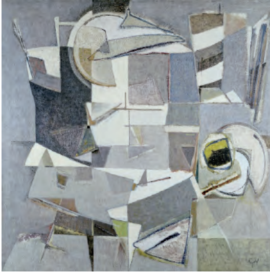
• © Geer van Velde (1898 Lisse, Pays-Bas – 1977 Cachan, France) Composition , 1962, huile sur toile, 190 x 190 cm. Collection Frac Île-de-France © ADAGP