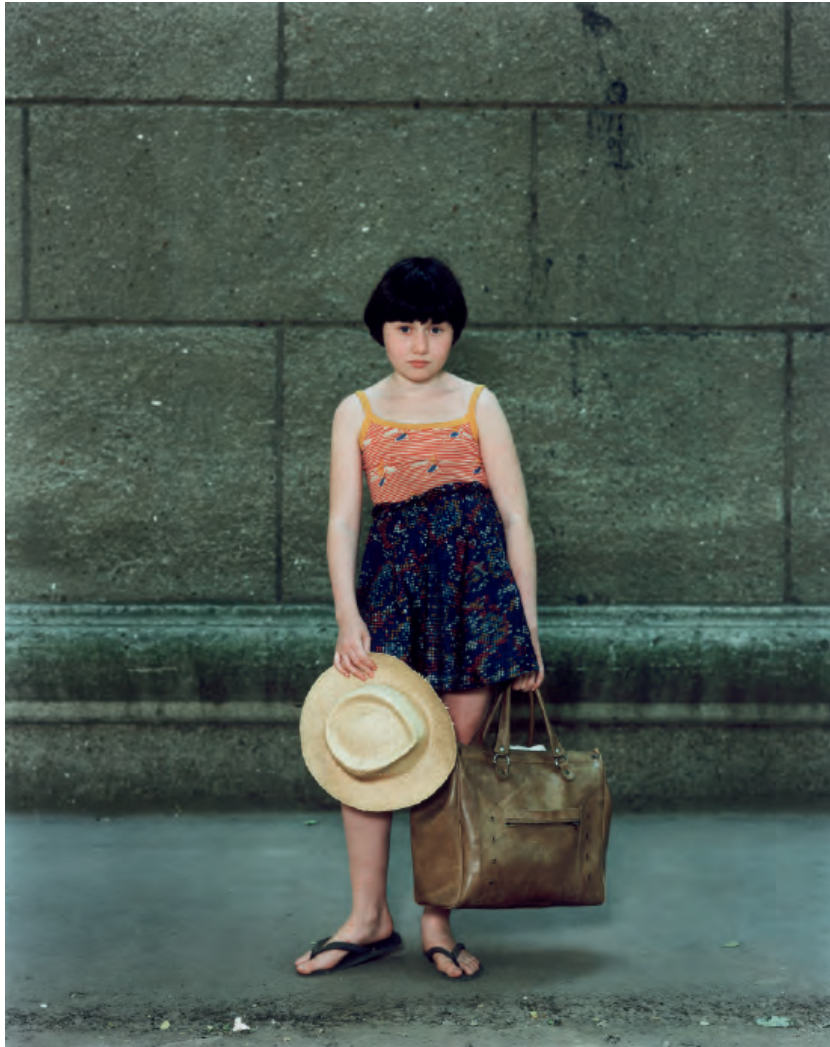
© Rineke Dijkstra (1959 Sittard, Pays-Bas), Odessa, Ukraine, 10 août 1993 , photographie couleur, 154 x 130 cm. Collection Frac des Pays de la Loire

Avec le soutien de Neuflyze OBC, en partenariat avec Télérama