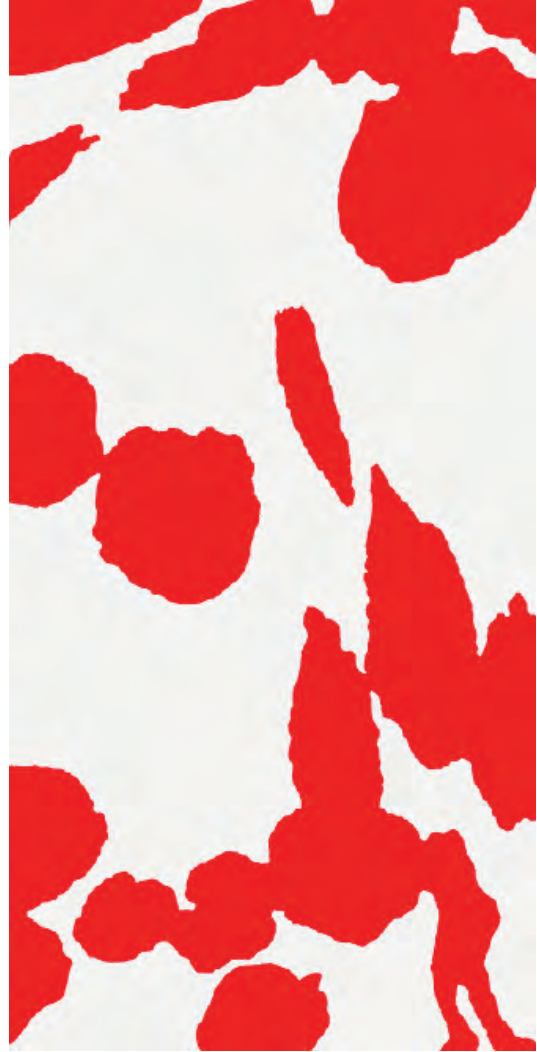
• © Daan van Golden (1936 Rotterdam, Pays-Bas), Heerenlux , 2003, crayon, laque et huile sur toile, 80 x 40 cm. Collection Frac Franche-Comté