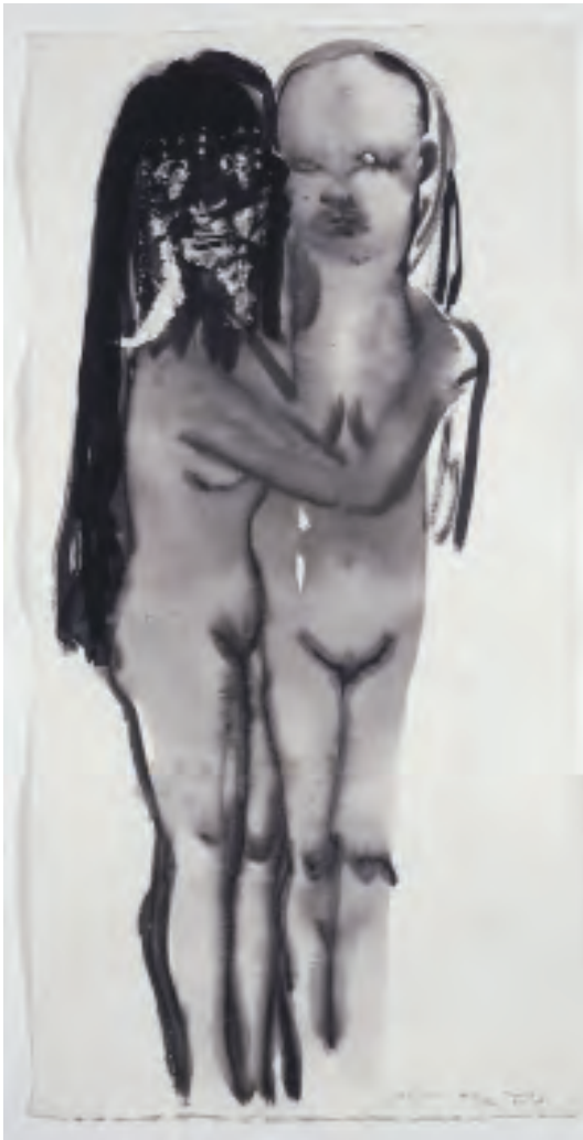
• © Marlene Dumas (1953 Le Cap, Afrique du Sud), Two of a kind , 1994, lavis de gouache et encre de chine sur papier, 96 x 48,2 cm. Collection Fonds régional d'art contemporain de Picardie