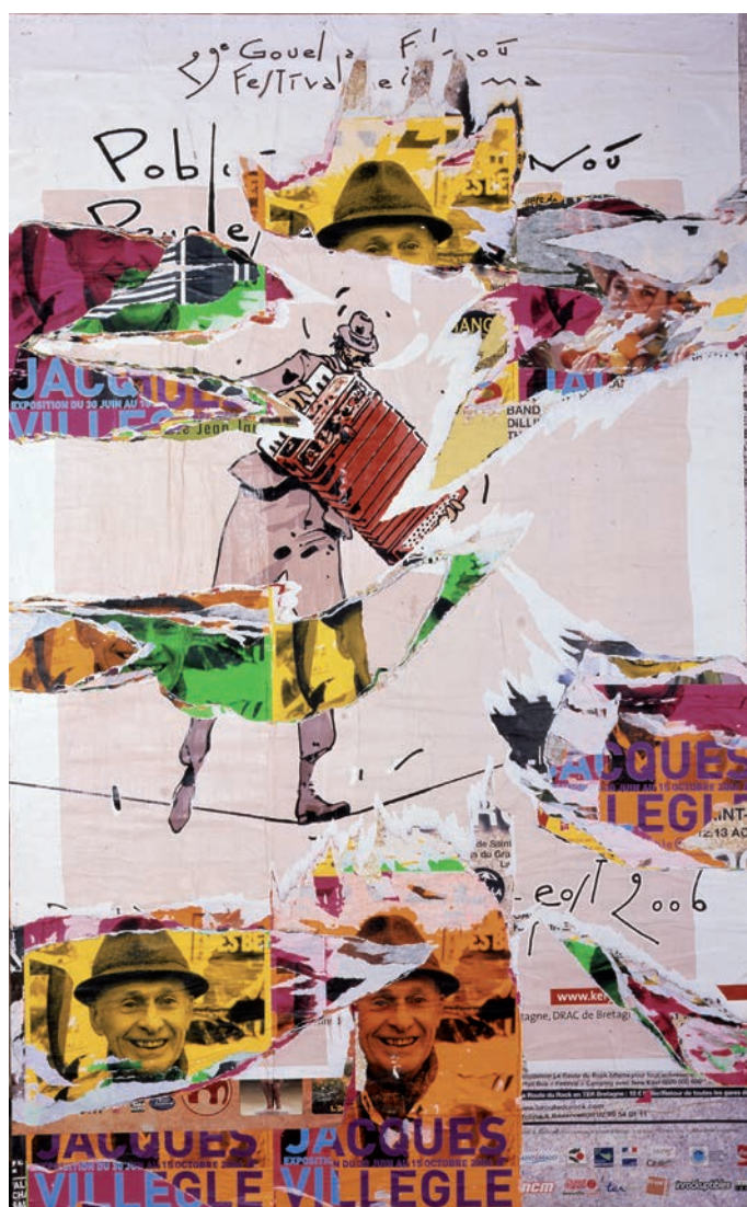
Jacques Villeglé, «Opération quimpéroise» - Rond-Point Chaptal, 2006, collection Frac Bretagne © ADAGP, Paris 2014

Commissariat : Catherine Elkar, directrice du Frac Bretagne