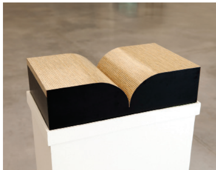
Book, 1987. Collection Frac Bretagne