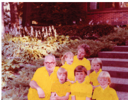
Untitled, Family in the garden / yellow, 2004 Collection Frac Bretagne.