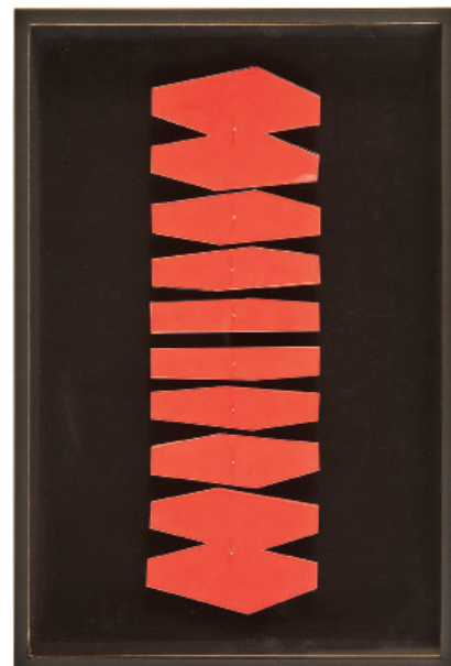
Clarence, 2006. Collection Frac Bretagne