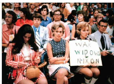
Sans titre, série «United States 1970-1975», 1970-2008. Collection Frac Bretagne