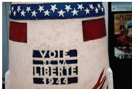
Conlie «Voie de la Liberté», 2003 © ADAGP, Paris 2015