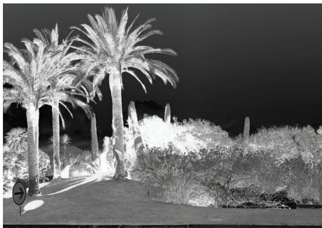
Le point étiré , 2015, (détail) © Pascal Pinaud

Sur la route , une exposition à caractère rétrospectif, met en jeu une centaine de pièces et permet de prendre la mesure d'une œuvre qui se développe depuis 25 ans. Pascal Pinaud (1964, Toulouse) cultive un champ élargi de la peinture. Il l'étend à la sculpture, à la photographie et à l'installation en passant par le recours à une grande variété de matériaux et de savoir-faire empruntés à la sphère domestique, artisanale ou industrielle. En articulant les activités d'un quotidien des plus communs à une pensée de la peinture des plus élaborées, il ouvre des horizons multiples et productifs.