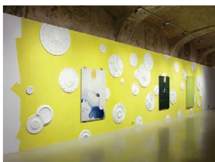
2. Exposition L'expérience du monde. Au présent , Vinzavod, Centre d'art contemporain, Moscou - 2010 Exposition organisée par Passerelle, centre d'art contemporain de Brest, en partenariat avec le Centre national d'art contemporain de Moscou (NCCA) avec le soutien de Culturesfrance.