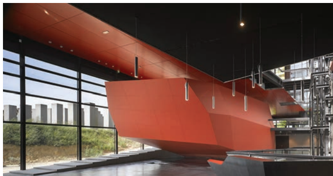
Frac Bretagne, Rennes © Odile Decq / ADAGP Paris 2014

Président du Frac Bretagne : Jean-Michel Le Boulanger Directrice du Frac Bretagne : Catherine Elkar