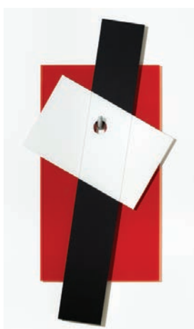
6. Patère II , mars - mai 2011 Collection A. M. et M. Robelin © Pascal Pinaud Crédit photo : François Fernandez