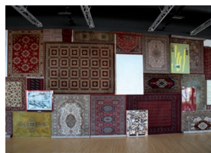
9. Exposition De leur temps, Le prix Marcel Duchamp, 10 ans de création en France, 6 novembre 2010 - 13 février 2011, Frac Alsace, Sélestat