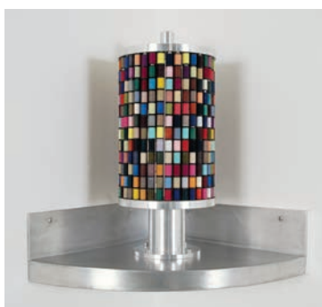
4. Moulin à prières , janvier 2001 Collection Frac Bretagne © Pascal Pinaud