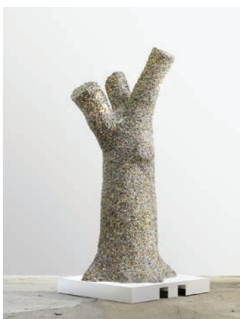
5. Arbre à Fèves , 2011 Courtesy : Galerie Nathalie Obadia, Paris/ Bruxelles © Pascal Pinaud Crédit photo : François Fernandez