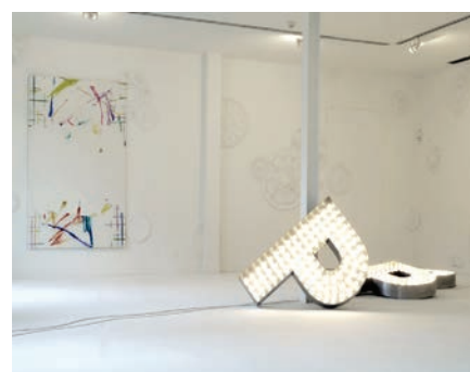
7. Exposition White de blanc , Frac Basse-Normandie, Caen - 2006 © Pascal Pinaud