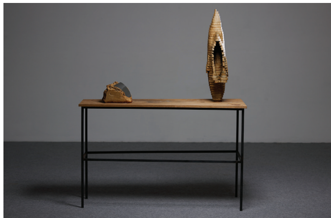
Marc Didou, Deux objets sur une table , 2003