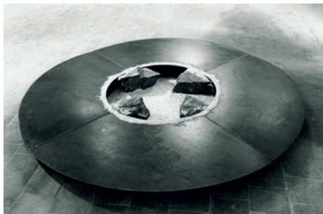
Jean Clareboudt, Élévation I , de la série Élévation , 1981 Collection Frac Bretagne © ADAGP, Paris 2016

Lyon (France), 1944 - 1997, Istanbul (Turquie)