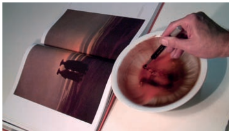
Sarkis, D'après Caspar David Friedrich : Deux hommes au crépuscule , 2007 Collection Frac Bretagne © ADAGP, Paris 2016

Né en 1938 à Istanbul (Turquie) Vit et travaille à Paris