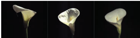
Jean-Marc Ségalen, Arum # 1 , 2006 Collection Frac Bretagne © Droits réservés Crédit photo : Droits réservés

Né en 1963 à Brest (France) Vit et travaille à Brest (France)