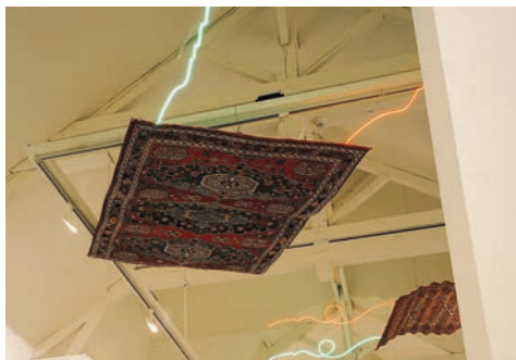
Patrice Carré, Tapis instantané , 1991 Collection Frac Bretagne © Droits réservés Crédit photo : Droits réservés

Né en 1957 à Angers (France) Vit et travaille à Marseille (France)