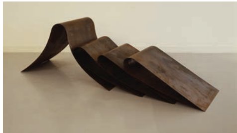
Carel Visser, Appui , 1977 Collection Frac Bretagne © ADAGP, Paris 2016

1928, Papendrecht (Pays-Bas) - 2015, Fousseret (France)