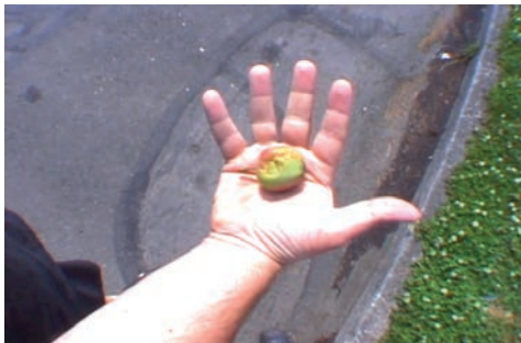
Harrell Fletcher, Hello There Friend , 2000 Collection Frac Bretagne © Droits réservés Crédit photo : Droits réservés

Né en 1967 à Santa Maria (États-Unis) Vit et travaille à Portland (États-Unis)