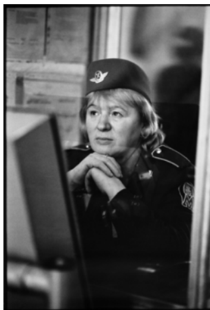
Olga Chernysheva, On Duty # 3 , 2007 Collection Frac Bretagne

Née en 1962 à Moscou (U.R.S.S.) Vit et travaille à Moscou (Russie)