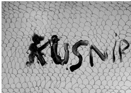
Carlos Kusnir, Sans titre , 2002 Collection Frac Bretagne © Adagp, Paris 2017

Né en 1947 à Buenos Aires (Argentine) Vit et travaille à Marseille (France)