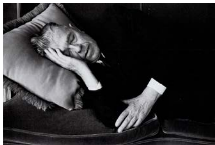
Duane Michals, Magritte asleep, 1958 Collection Frac Bretagne

Né en 1932 à McKeesport (États-Unis) Vit et travaille à New York (États-Unis)