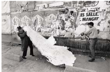
François Poivret, Issy-les-Moulineaux - 1 , de l'ensemble : Portrait de Jacques Villeglé , 28 janvier 1991 Collection Frac Bretagne

Né en 1959 à Bayeux (France) Vit et travaille à Rennes (France)