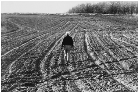
Denise Colomb, Raoul Ubac , 1967 Collection Frac Bretagne © RMN-Grand Palais Crédit photo : Hervé Beurel

Denise Colomb s'intéresse à la photographie à la faveur de ses premiers voyages au Moyen-Orient au milieu des années trente. Elle y enregistre le quotidien des populations rencontrées ainsi que la splendeur des paysages. Ces premiers reportages paraissent entre 1947 et 1951 dans Point de Vue - Images du monde .