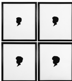
Yann Sérandour, Schwarzkopf , 2006 Collection Frac Bretagne © Yann Sérandour

Né en 1974 à Vannes (France) Vit et travaille à Rennes (France)