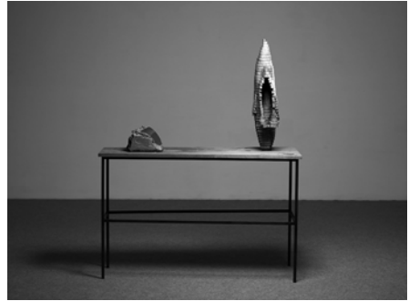
Marc Didou, Deux objets sur une table , 2003 Collection Frac Bretagne © Marc Didou

Né en 1963 à Brest (France) Vit et travaille à Lesneven (France)