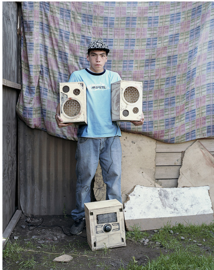
Nicolas Floc'h, Le Grand Troc , 2008 Collection Frac Bretagne © Adagp, Paris 2020

Nicolas Floc'h est un artiste en 1970 né à Rennes. Il fait à la fois des photographies, des films, des sculptures, etc.