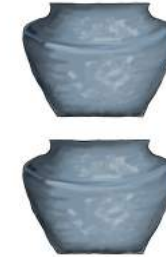
Le vase et les formes imprimées