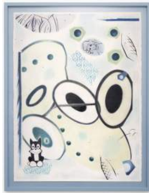
Hippolyte Hentgen, Ikebana, 2018