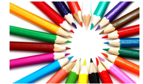
Crayons de couleur

1- Choisis un des deux côtés du coloriage et utilise uniquement ton crayon à papier pour le remplir : si tu veux obtenir une zone claire, appuie très doucement sur ton crayon et si tu veux une zone très foncée appuie plus fort. Tu vas obtenir une moitié de dessin en niveaux de gris, c'est à dire uniquement en noir et blanc !