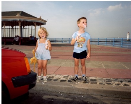
Martin Parr, New Brighton, England. 1983-85.

Au début des années 80, beaucoup de photographes préféraient le noir et blanc alors que la photographie couleur existait déjà. Les images en couleur étaient plutôt réservées aux photos de vacances.