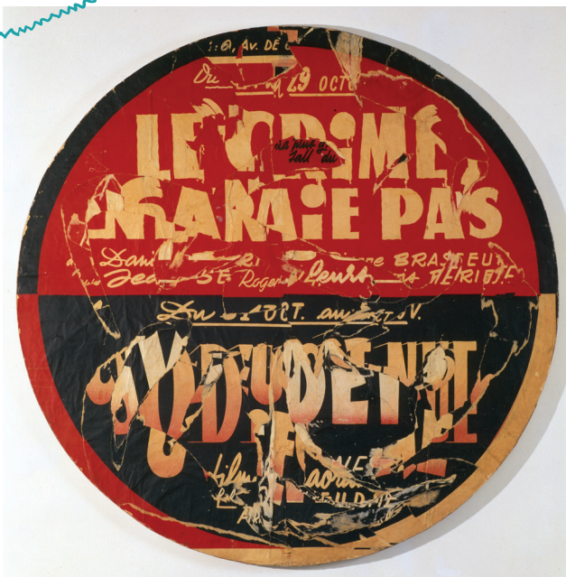
Jacques Villeglé, Rue de Tolbiac - Le crime ne paie pas, sous-titre : «Pathé-Journal», 26 octobre 1962 Collection Frac Bretagne