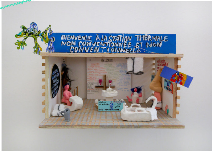
Anaïs Touchot, J'y laisserai ma vieille peau , 2020.

Anaïs Touchot est une artiste originaire de Bretagne. Ce qu'elle préfère, c'est collecter des matériaux (du bois, des vieux meubles, des plantes, du tissu) pour fabriquer de nouveaux espaces. Pour elle, le moment de la fabrication est aussi important que le résultat.