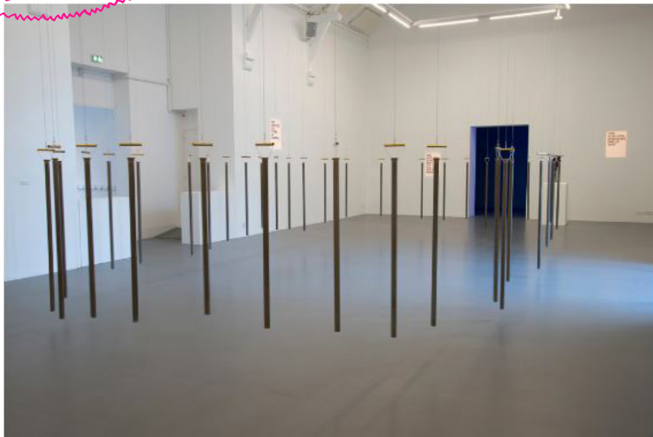
David Horvitz, Lullaby for a Landscape (Luskellerez Vor) (Berceuse pour un paysage) , 2019. Collection Frac Bretagne © David Horvitz.

David Horvitz est un artiste américain né à Los Angeles. Dans son installation Berceuse pour un paysage , il rend hommage à la Bretagne. Il suspend au plafond 40 carillons en cercle. Ces cloches en forme de tube ont été exposées à la pluie, au vinaigre de cidre et à l'eau de mer. Les spectateurs sont invités à les faire résonner avec des bâtons de bois ramassés sur la plage. Chaque carillon fait alors sonner une note d'une mélodie bretonne traditionnelle : la Berceuse de la Mer .