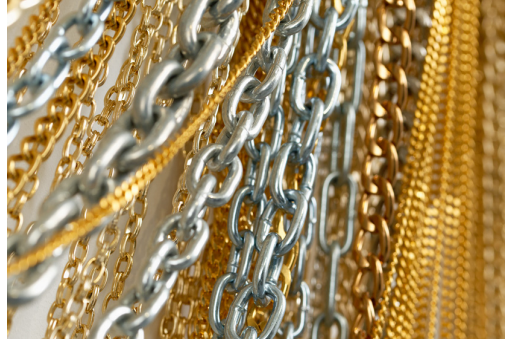
Détail de la sculpture en chaines