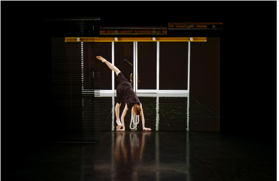
Détail de la vidéo (No)Time de Pauline Boudry et Renate Lorenz

Devant la vidéo, il y a des rideaux électriques qui montent et qui descendent .