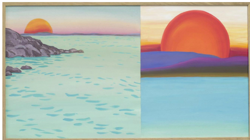
Charlotte Vitaoli, Sucre à la crème , 2017, © Adagp, Paris Crédit photographique : Visuel fourni par l'artiste

Charlotte Vitaoli est une artiste qui vit à Rennes. Parmi ses sujets favoris, on retrouve l'histoire de l'art, le cinéma, la mythologie, etc. Elle utilise entre autres, le dessin, la broderie, le tissu pour recréer des souvenirs ou des extraits de films, de tableaux.