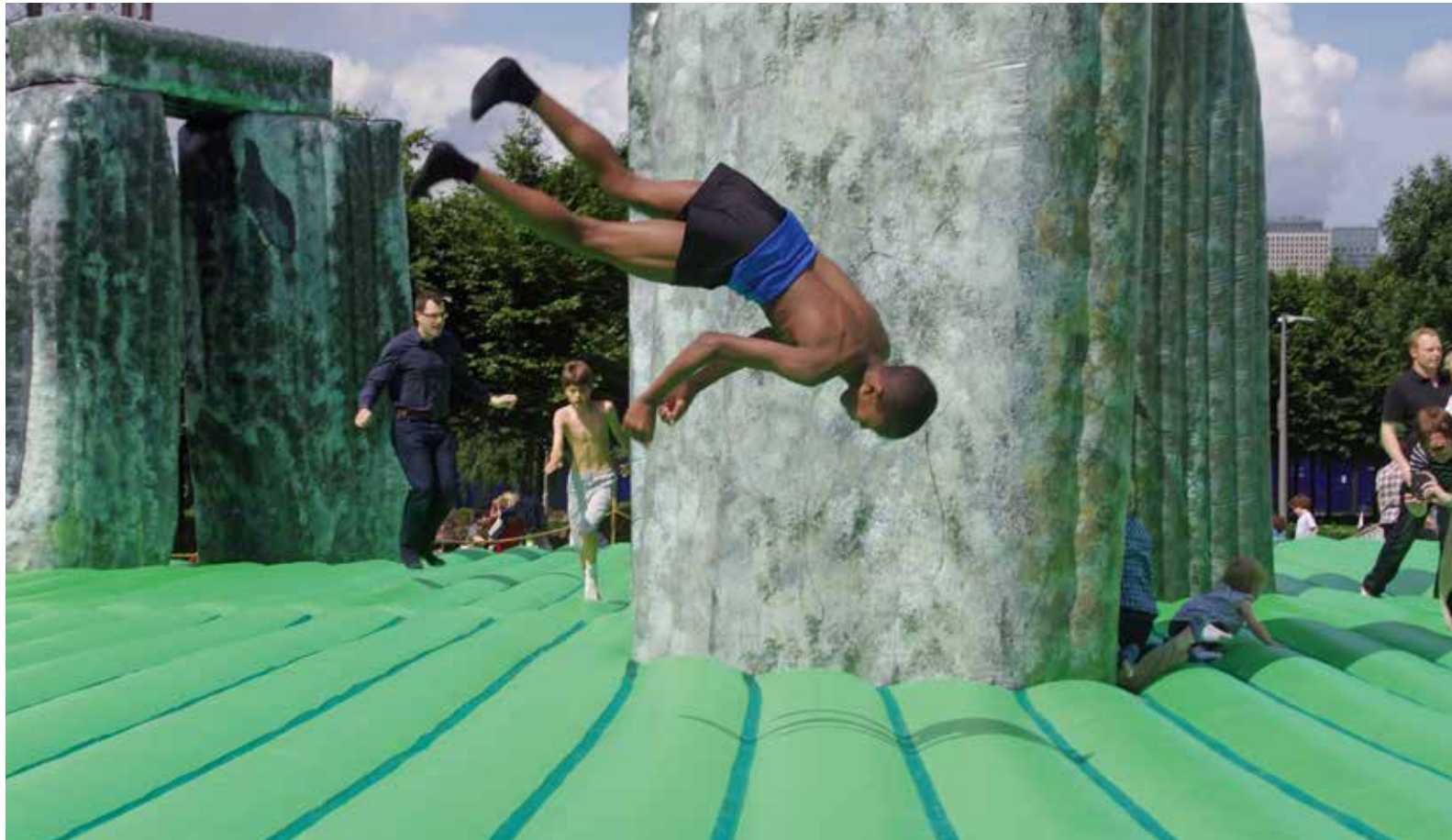
Jeremy Deller, Sacrilege , 2012, installation view Greenwich, London/UK

est entrecoupé de séquences fascinantes et parfois anodines, comme le vol d'oiseaux de proie au ralenti, des Land Rover dans une casse automobile, un défilé ou encore des enfants s'amusant sur le site de Stonehenge dans une structure gonflable. L'œuvre a été conçue et réalisée pour le pavillon britannique de la 55 e Biennale internationale d'art de Venise.