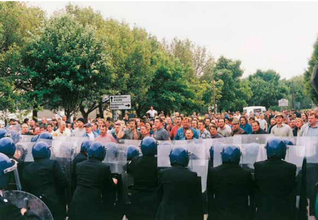
The Battle of Orgreave Archive Participating former miners on the day of the performance © Jeremy Deller. Tate Collection. Photo : Parisah Taghizadeh. Courtesy de l'artiste ; The Modern Institute / Toby Webster LTD, Glasgow ; Art : Concept, Paris

En 1984, sous le gouvernement de Margaret Thatcher, une grève des ouvriers des mines de charbon secoue la Grande-Bretagne. À Orgreave, près de Sheffield, une manifestation mobilise plusieurs milliers de mineurs le 18 juin 1984 : elle est violemment réprimée par les forces de police, faisant une centaine de blessés. Quatorze ans après les faits, Jeremy Deller propose d'exhumer ce fait pour lui donner un traitement plus digne, en rassemblant un millier de participants, dont des habitants locaux et des anciens mineurs. L'installation met à disposition du public toutes les ressources (documents d'archives, interviews, livres, vidéos...) concernant les événements de 1984 et la reconstitution de la manifestation.