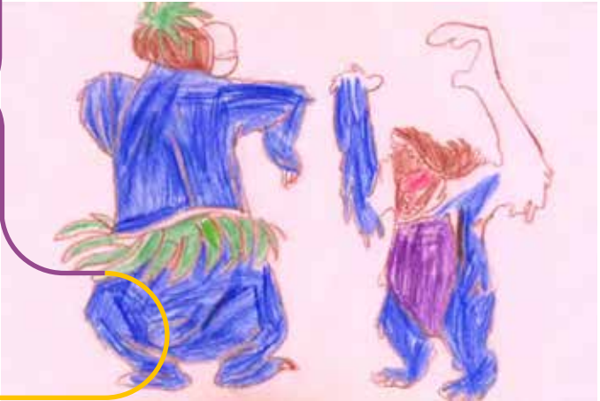
Collection Frac Bretagne © Oliver Beer