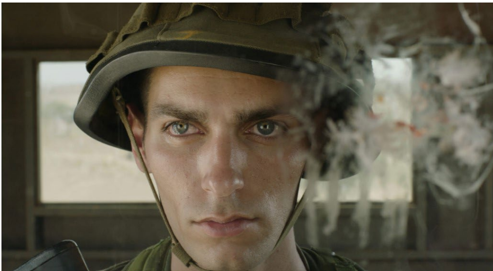
Ali Cherri, The Watchman , 2023 (capture-détail)

Le songe d'une nuit sans rêve est la première exposition personnelle d'Ali Cherri dans une institution en France.