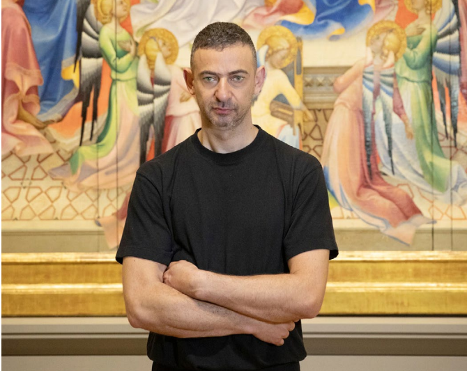
Ali Cherri.

Ali Cherri (1976, Beyrouth, Liban) Vit et travaille à Paris (France).