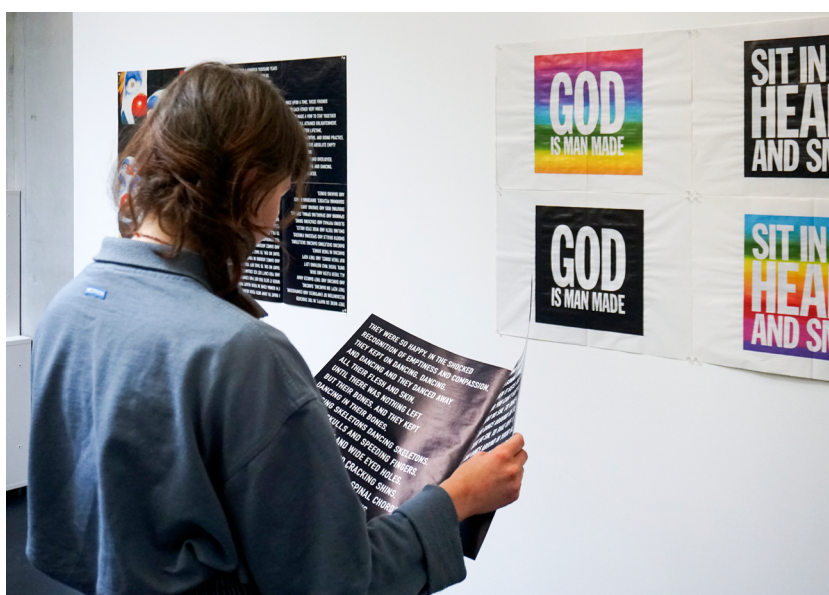
Cimaise "John Giorno. Le point d'ironie", juin - septembre 2022.

Les réunions de programmation, de formation du service des publics pourront se faire plus régulièrement au sein du centre de documentation, ce qui permettrait de faire des propositions de ressources sur des thématiques et de les sortir directement, et d'être plus réactives.